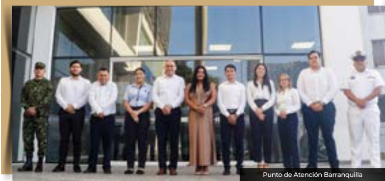
Punto de Atención Barranquilla