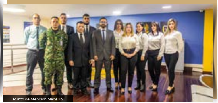
Punto de Atención Medellín