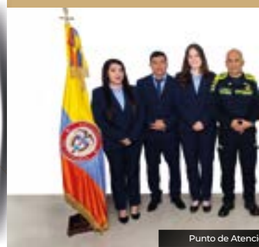
Punto de Atención