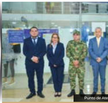
Punto de Atención