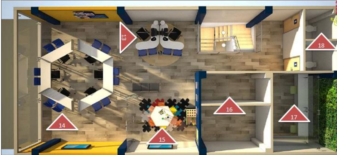
Imagen 2 Diagrama Segundo Piso