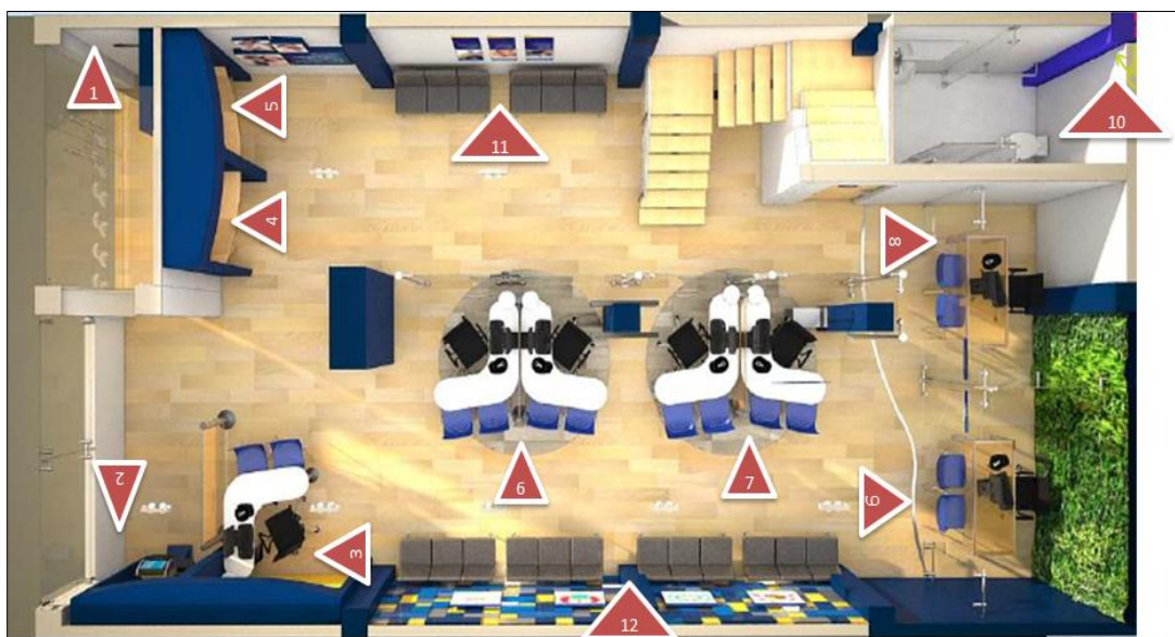
Imagen 1 Diagrama Primer Piso

Diagrama Segundo Piso: Compuesto por las siguientes áreas, identificadas así: