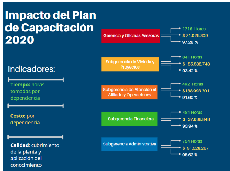
Figura 1, Fuente: Área de Talento Humano 2020

Las modalidades académicas por medio de las cuales se dio cubrimiento a las necesidades de capacitación son: Diplomado (9) Curso (43) Certificaciones (2) Seminario (2) Taller (3) Conferencias y charlas (7) membresía educativa (1).