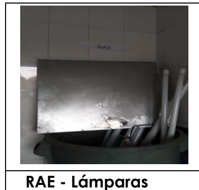
RAE - Lámparas