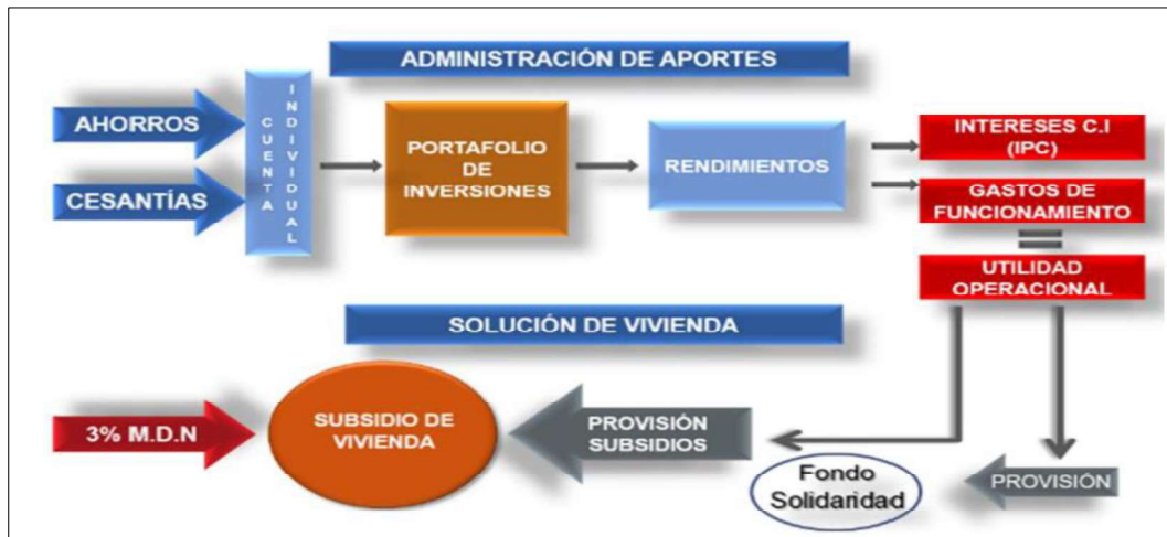
Figura 03. Ciclo Financiero Caja Honor. Fuente: comunicado a la SFC del 07-05-2021 con radicado 03-01-20210507018193.