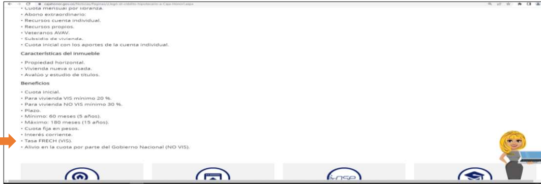
Figura 12. Evidencia consulta OFCIN link Crédito Hipotecario CPVMP https://www.cajahonor.gov.co/Noticias/Paginas/%C2%A1Lleg%C3%B3-el-cr%C3%A9dito-hipotecario-a-Caja-Honor!.aspx . Fuente: consulta OFCIN 15-11-2022.

Se evidencia actualizado posterior al traslado de la OFCIN con fecha 29-11-2022 así: