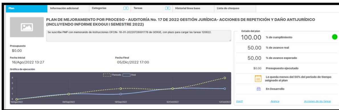
Fuente: Imagen 1. Suite Empresarial Plan de Mejoramiento OAJUR, elaboración OFCIN: 11-10-2022.

La OFCIN, evidencia el avance que ha realizado el proceso OAJUR frente al Plan de Mejoramiento por Proceso como se observa: