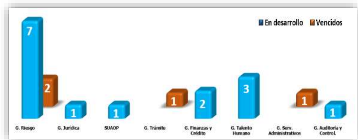
Figura 2. PMP, activos a enero 31 de 2024

3.2. La OFCIN realiza el monitoreo y seguimiento a los 19 PMP de los cuales 4 se encuentran vencidos al corte del presente informe, apoyando continuamente a los responsables de gestionar las tareas; a través de herramientas colaborativas y direccionamiento operativo del aplicativo indicando el paso a paso de acuerdo con el rol del usuario; con el fin de minimizar los planes vencidos contribuyendo al fortalecimiento de la cultura del autocontrol.