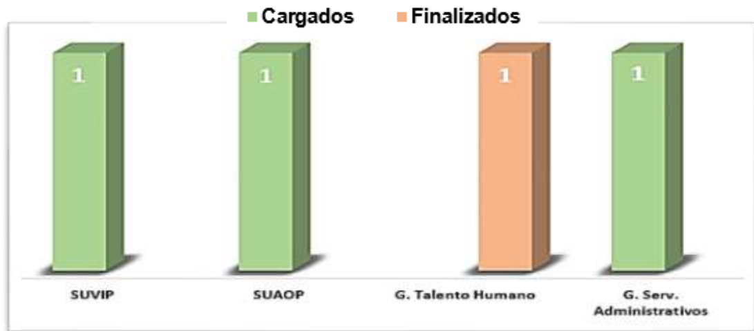
Figura 1. PMP cargados o nuevos y finalizados del 01-02-2024 al 29-04-2024