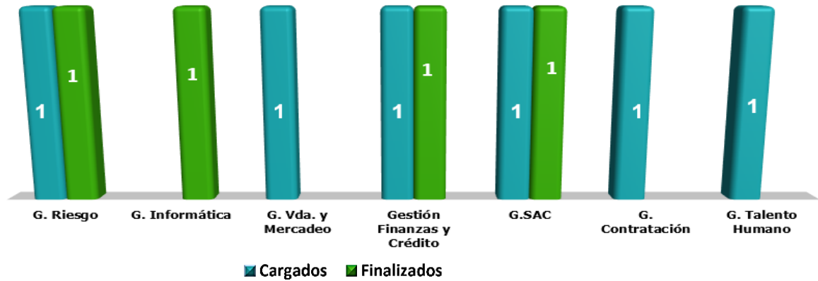
Figura 1. PMP cargados o nuevos y finalizados del 29 de abril al 28 de julio 2022 Julio 28 2022

parte de la OFCIN, acortando tiempos de respuesta y contribuyendo significativamente con la política de cero papel, asimismo con la sostenibilidad ambiental.