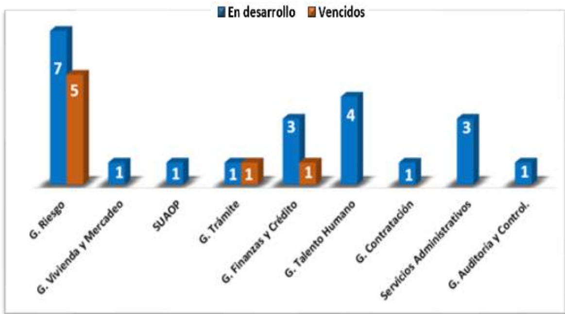
Figura 2. PMP, activos a julio 29 de 2024 Fuente: SVE. Julio 29 - 2024