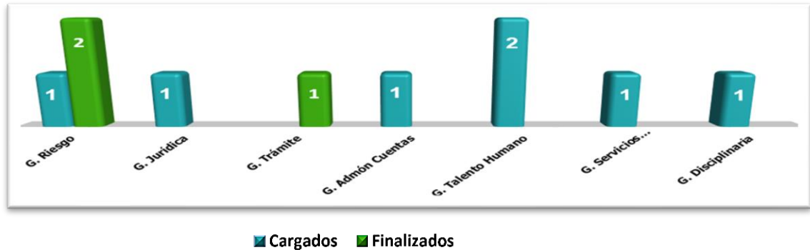
Figura 1. PMP cargados o nuevos y finalizados del 29 de julio al 31 de octubre 2022 Octubre 31 2022

3.1. La OFCIN ha cargado 7 PMP y ha finalizado 2 en la herramienta SVE – módulo planes, de forma pertinente y oportuna, alineado con el objetivo estratégico “Promover la innovación y transformación digital en la prestación del servicio y la mejora continua de los procesos”; la cual brinda mayor agilidad, eficiencia y eficacia para los procesos como en el seguimiento por parte de la OFCIN, acortando tiempos de respuesta y contribuyendo significativamente con la política de cero papel, asimismo con la sostenibilidad ambiental.