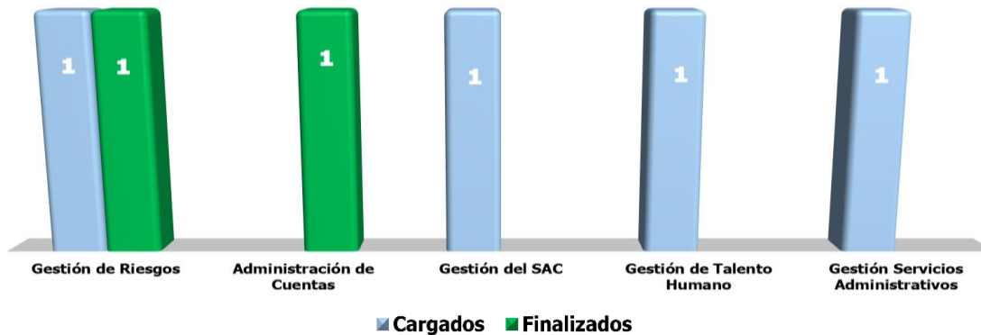
Figura 1. PMP cargados o nuevos y finalizados del 29 de enero al 26 de abril 2021 Abril 26 2021